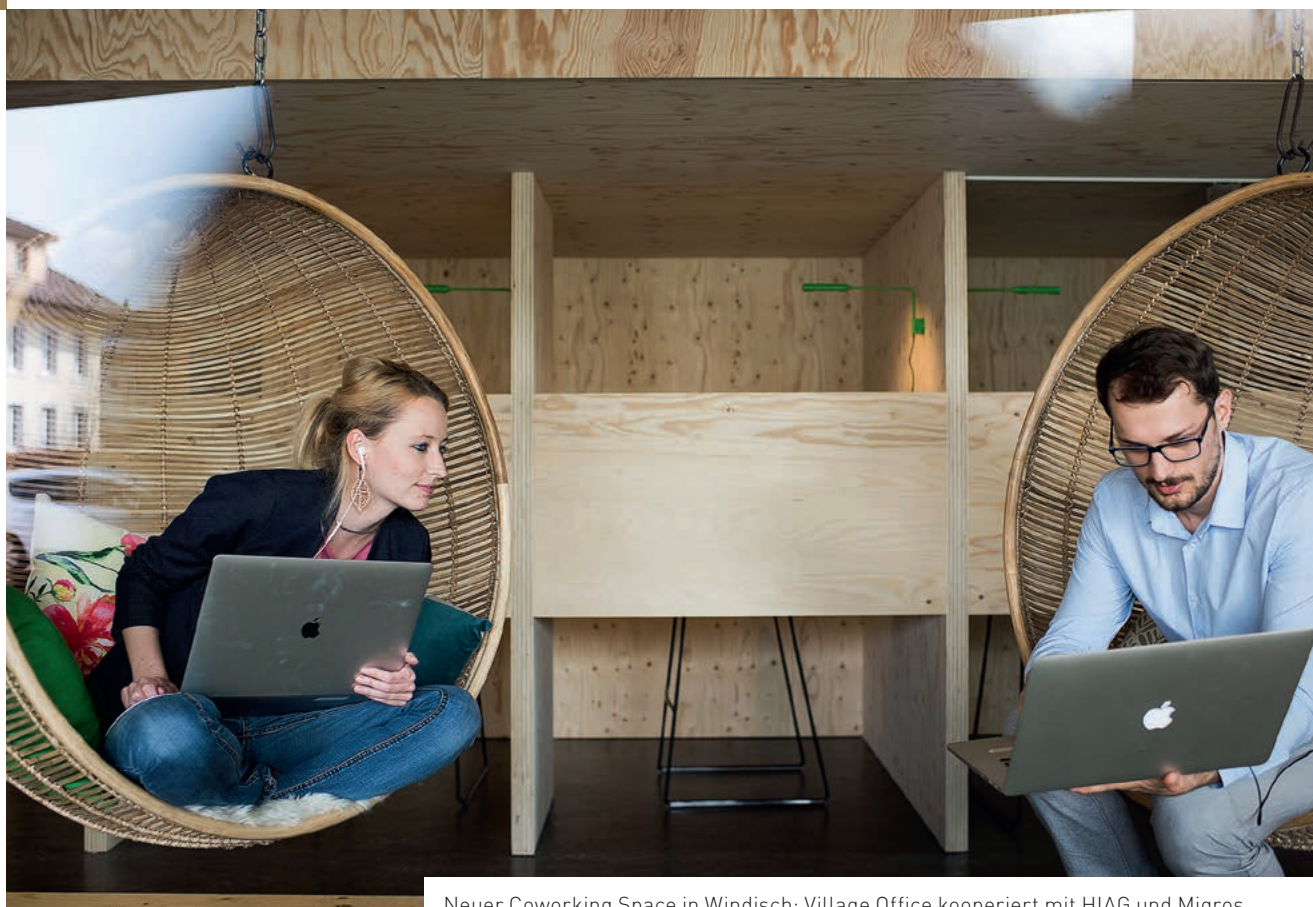
Neuer Coworking Space in Windisch: Village Office kooperiert mit HIAG und Migros

Von Mathias Rinka – Bilder: Ruben Wytttenbach; Office LAB, Village Office